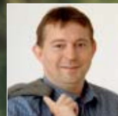
Stefan Mörsdorf, Minister für Umwelt