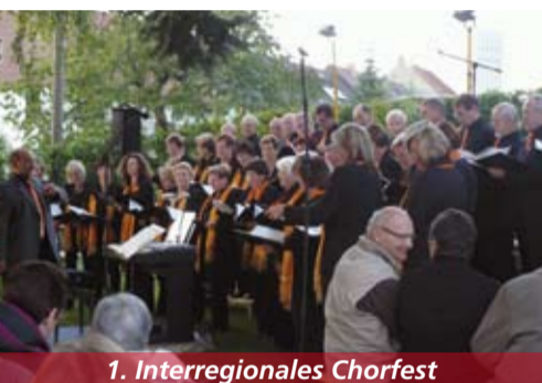
1. Interregionales Chorfest