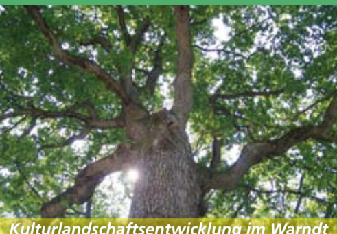
Kulturlandschaftsentwicklung im Warndt