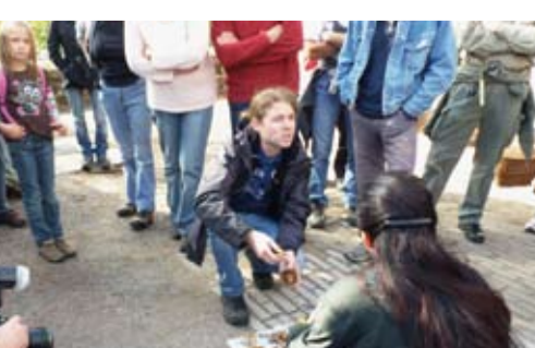
Heimischen Pilzen auf der Spur