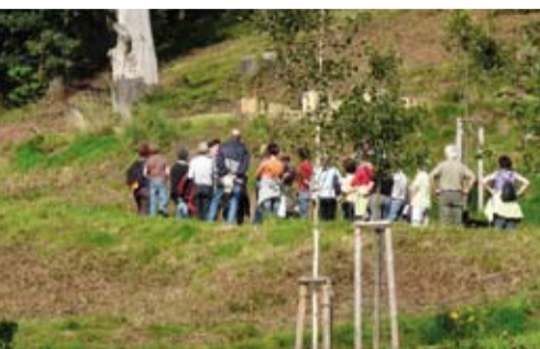
Wanderung durch den Forstgarten